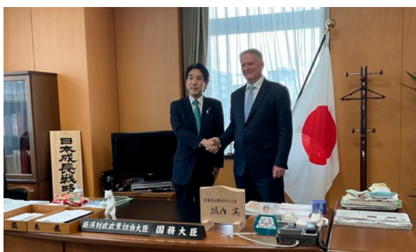
図表3 城内大臣との会談写真

このほか、公表に関連する付随的なイベントの一つとして、OECD事務局と大学関係者等との間で意見交換の場が設けられ、対日経済審査の知見を幅広い層と共有する機会となった。こうしたイベントは、審査結果を政府内にとどめることなく、社会全体に共有するという点で意義が大きい。