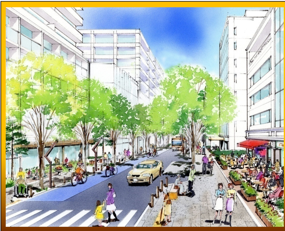
市街地中心部の ヘルシーロード整備

高齢者、障害者を含めた全ての市民が社会参加できる環境 市街地中心部からの良質な健康と生活のための都市